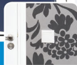
tapetes / обои