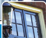
krāsa / окрашенные поверхности

также для окрашенных поверхностей и обоев